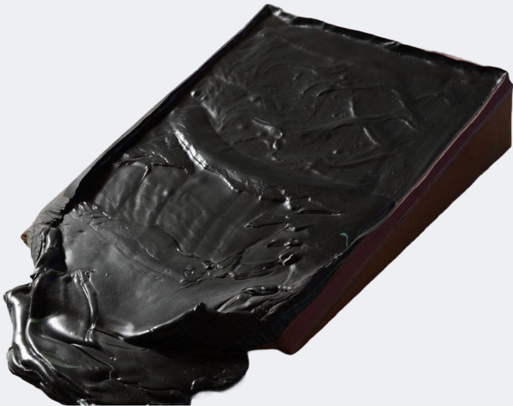
Mistérios #11, 2013.