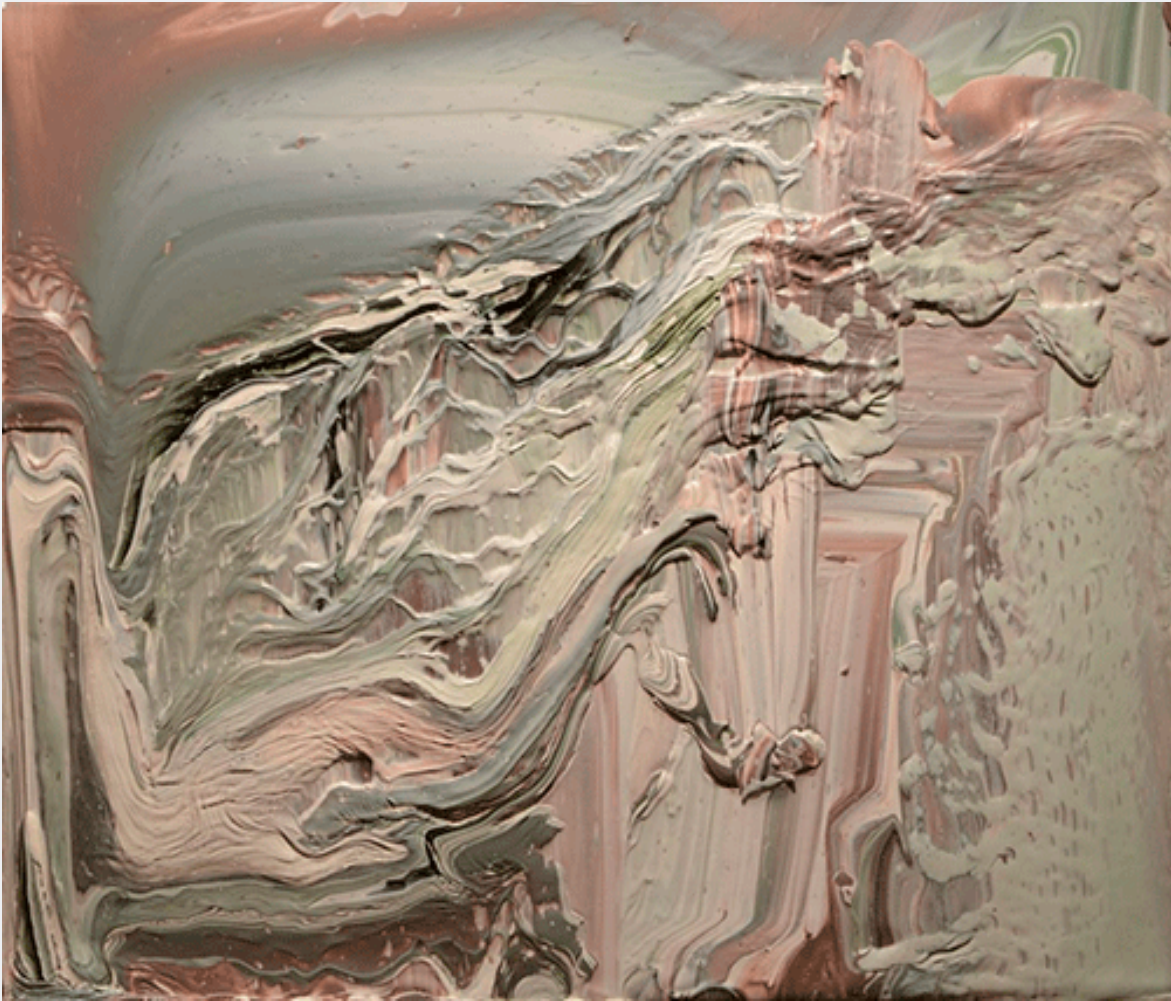
Levantar #1, 2017. 140 x 160 cm. Tinta de membrana plástica sobre madeira.