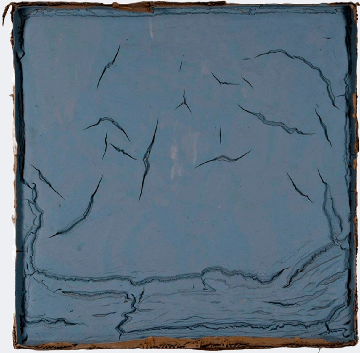
Supressão das barreiras II, 2012. 70 x 70 x 6 cm. Tinta plástica sobre mdf, com vestígios de cartão prensado.