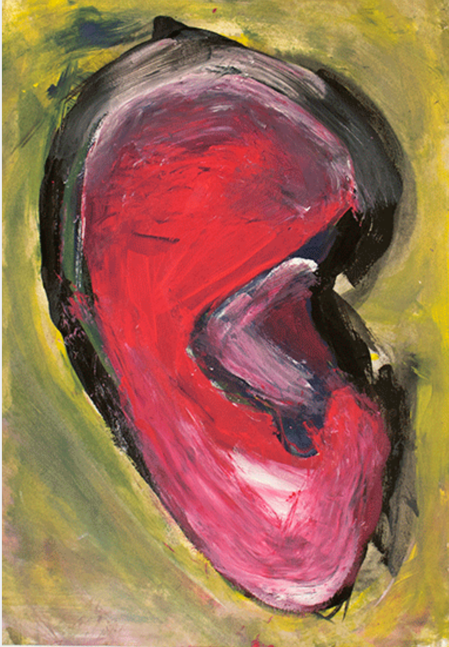
O oscilante #20, 2023. 29,7 x 21 cm. Tinta-da-china, tinta acrílica e guache sobre papel.