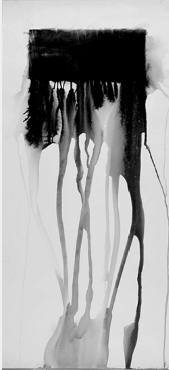
Processo #1, 2013. 151 x 70 cm. Grafite aguarelado sobre papel Fabriano.