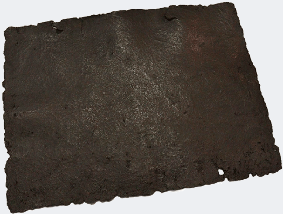
Presença, 2019 74 x 98 cm. Pasta de papel e grafite em pó.